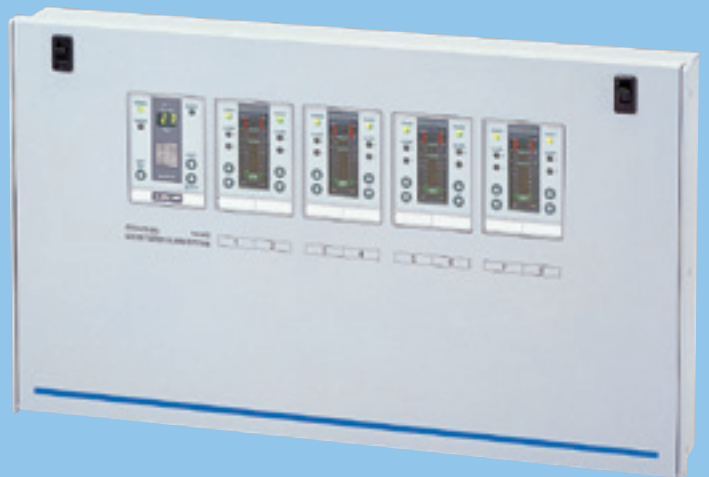
报警指示部 照片是8点式。 除此之外还有2·4·6·10·12点式。